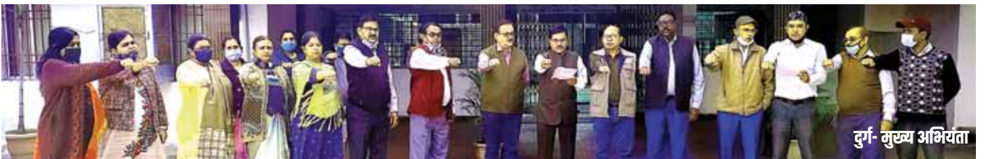
दुर्ग- मुख्य अभियंता