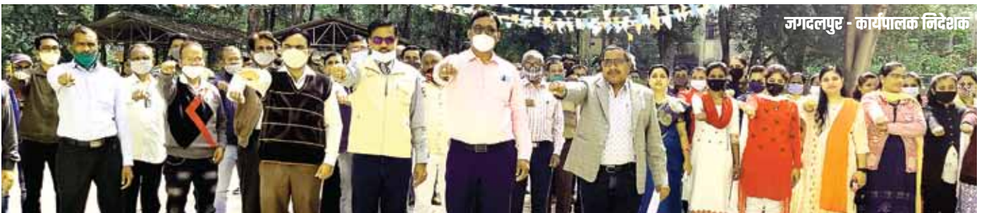
जगदलपुर - कार्यपालक निदेशक