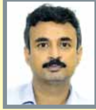
श्री अंकित आनंद (IAS)