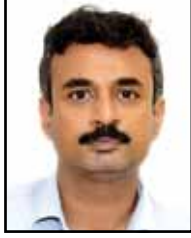
श्री अंकित आनंद (IAS) अध्यक्ष