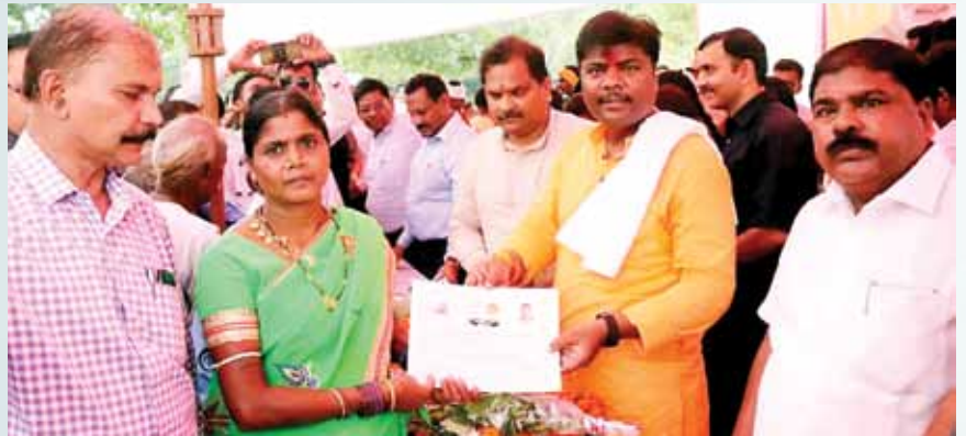
पंचायत एवं आसपास के क्षेत्र के गणमान्य नागरिक